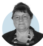
Laurence Debacq Copropriétés et équipements

Hélène anime les observatoires de l'agriculture, de l'eau et des milieux aquatiques. Elle réalise les études sur les milieux naturels et les paysages.